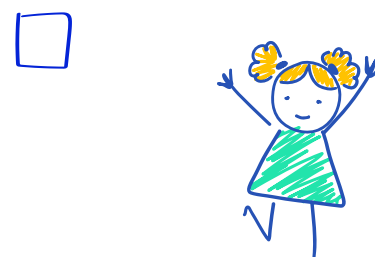
Contacten leggen met kinderen in een opvangcentrum