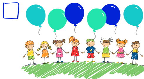
Activiteiten voor kinderen begeleiden