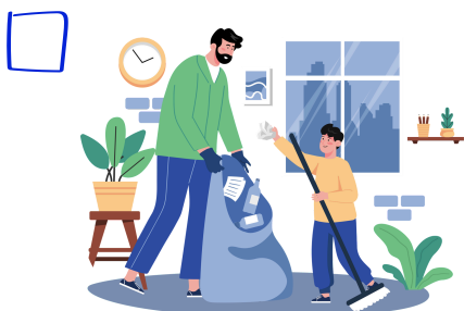
Afval verzamelen (wanneer je gaat wandelen)