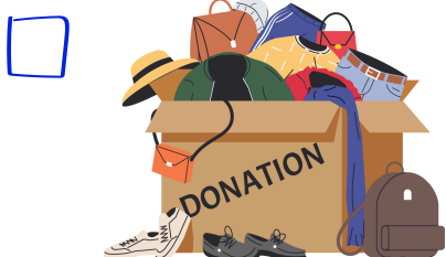
Kleren verzamelen en doneren aan mensen in nood