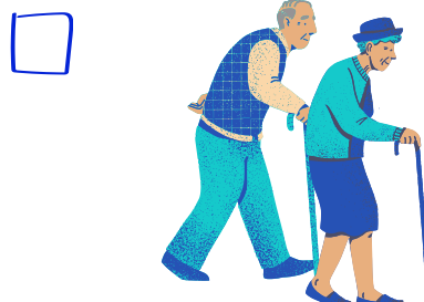
Ouderen helpen in je buurt